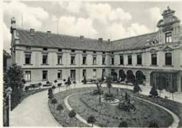
Göppingen: Neue Werkstatt, linker Flügel.