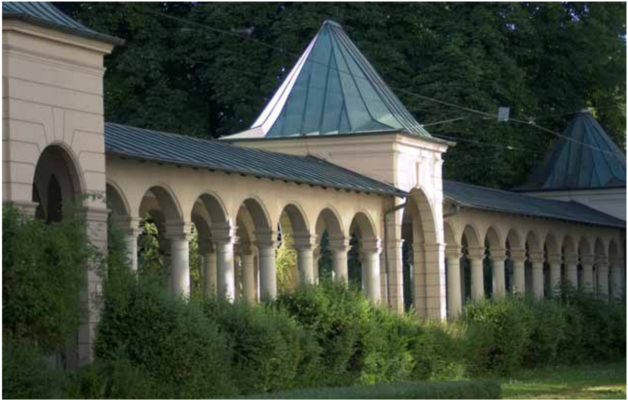
Abbildung: Orthopädischen Fachkliniken, Park mit Arkaden

Sehr geehrte Leserin, sehr geehrter Leser,